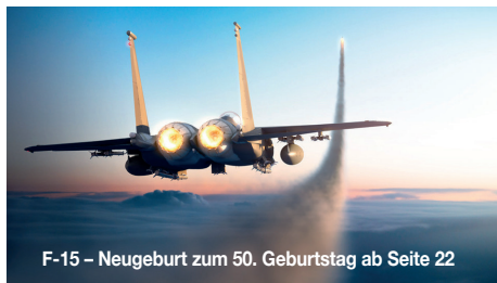
F-15 – Neugeburt zum 50. Geburtstag ab Seite 22