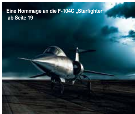
Eine Hommage an die F-104G „Starfighter“ ab Seite 19