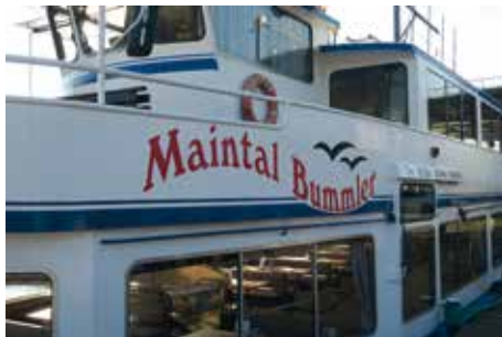
Der Maintal Bummler

Mit dem uns allen bekannten Fliegermarsch beendete die Stadtkapelle ihr Platzkonzert und nun ging an Bord.