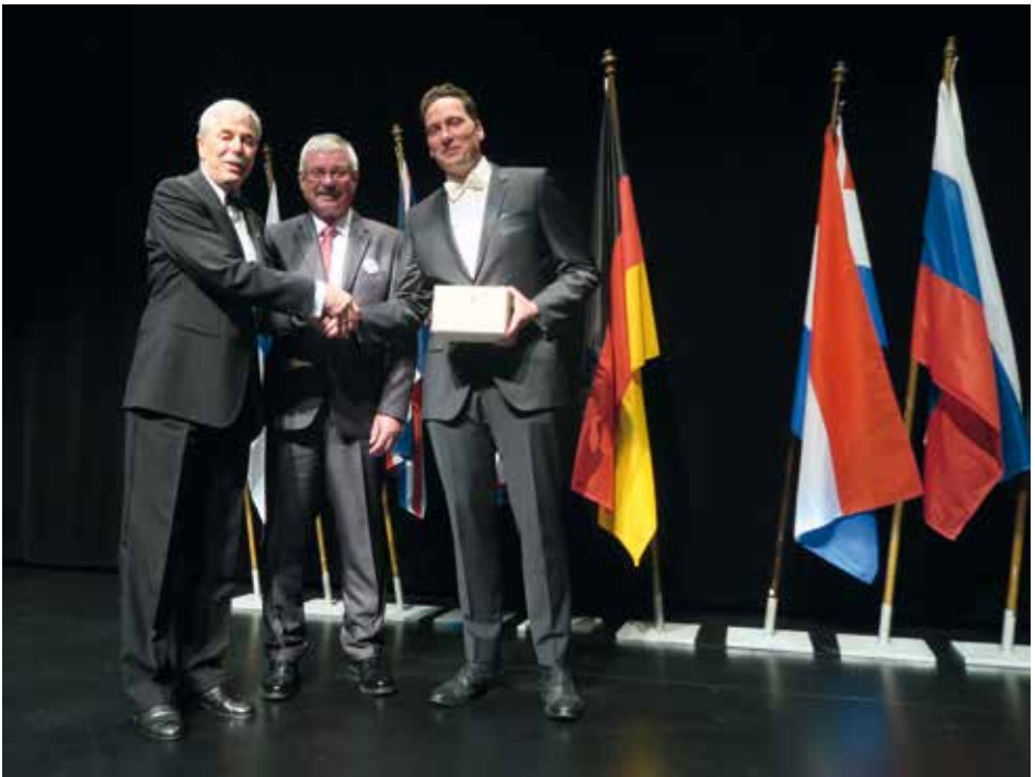
Die Präsidenten und der Bürgermeister