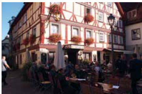
Mittagessen im Haus Schönbrunnen