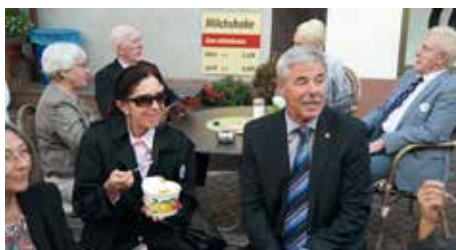
Eis im Straßencafé