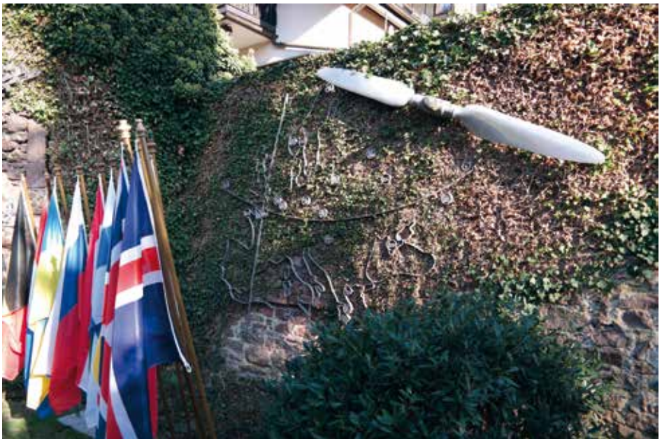
Das Ehrenmal der deutschen Transportflieger