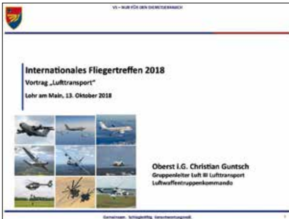
Der Titel der Präsentation

Nach den beiden Vormittagsveranstaltungen konnte jeder der wollte im Gasthof Schönbrunnen zu Mittag essen oder sich in einem Straßencafé ein schönes Eis genehmigen, das Wetter war ja entsprechend.