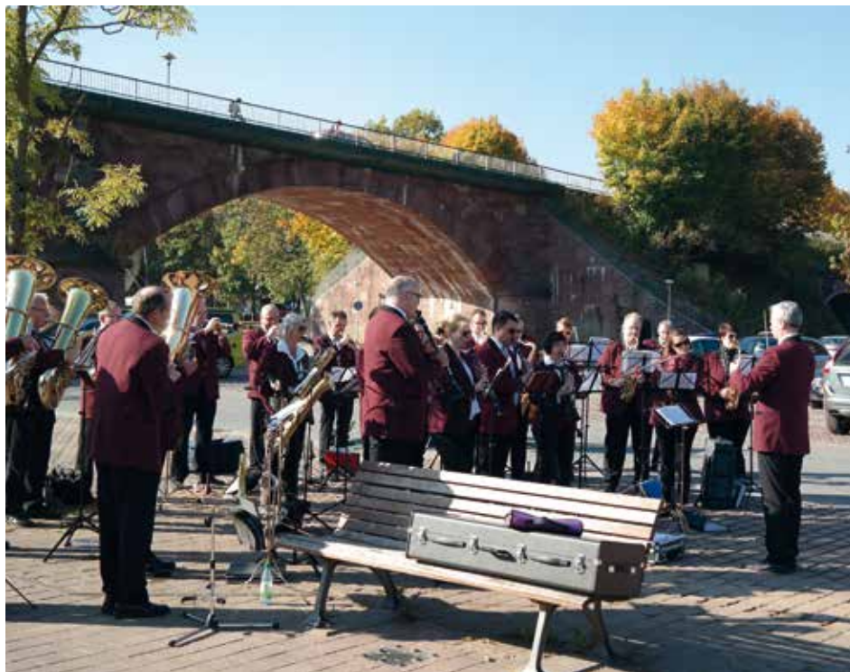
Die Stadtkapelle Lohr