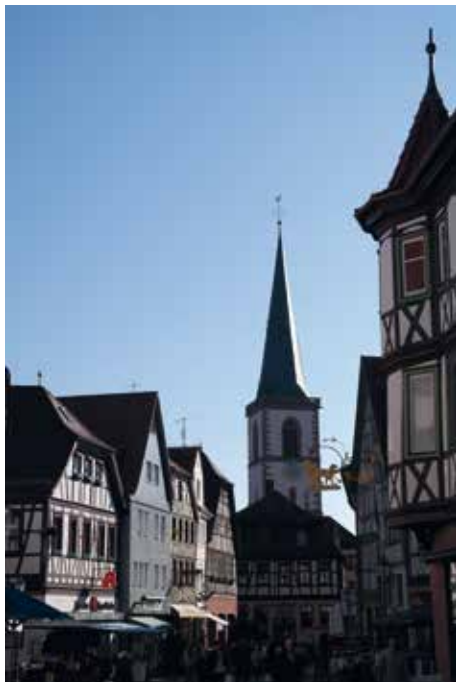
Die Lohrer Altstadt