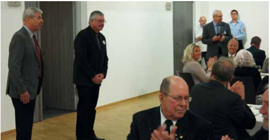
Begrüßung in der „Alten Turnhalle“

Der Präsident betonte, dass er heute bei der Freien Jagd ausnahmsweise eine beson-