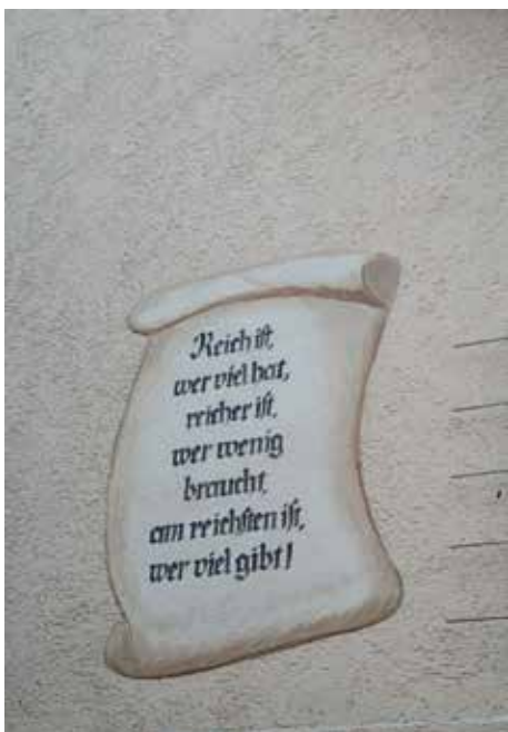
So manch eine Weisheit wurde vermittelt