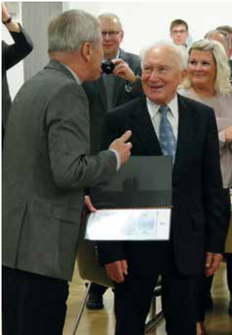
Unser neues Ehrenmitglied Sigmund Jähn

In seiner Laudatio betonte er, dass heute das uns allen bekannte Mitglied, der erste deutsche Kosmonaut, der vor 40 Jahren seinen Weltraumflug absolvierte, der seit 2004 Mitglied unserer Gemeinschaft ist, mit großen Verdiensten bei der Integration der Fliegerkameraden der LSK/LV sowie bei der Entwicklung der Zusammenarbeit mit den Kameraden aus Russland und der Ukraine, der engagierte Betreuer von Ost-West Delegationen bei Reisen und Fliegertreffen und der überzeugende Vertreter der Zielsetzungen unserer Gemeinschaft ausgezeichnet wird.