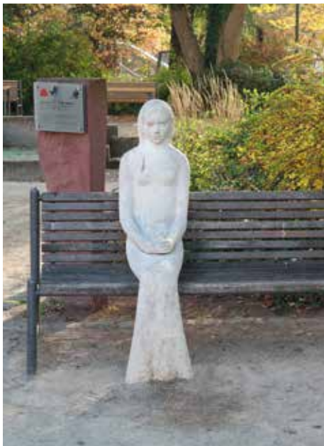
Schneewittchen auf der Parkbank