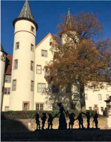
Schloss Lohr mit Schneewittchenmuseum

Für unsere Gäste und Damen hatten wir einen Besuch des Schneewittchenmuseums im Schloss Lohr angeboten, denn Lohr nennt sich ja auch die Schneewittchenstadt.